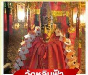
วัดหลิบฟ้า