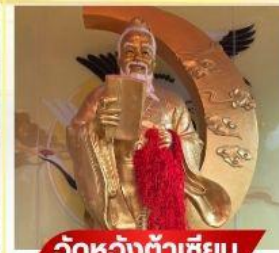
วัดหวังต้าเซียม