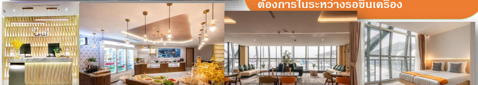
The Coral Finest Business Class Lounge – International (BKK) Departure Gate D1

เติมอัมไปกับ 2 ชม. เติม ณ เลจน์ ที่สร้างมาเพื่อเป็นห้องพักรับรองสนามบิน ที่ให้ความรู้สึกสบายเหมือนอยู่บ้าน ให้ท่านได้เพลิดเพลิน, พักผ่อน, รีแลกซ์, เคลียร์งานทานอาหารอร่อย ๆ ใน The Coral Lounge ที่ตอบโจทย์ทุกความสะดวกสบายที่ท่านต้องการในระหว่างรอขึ้นเครื่อง