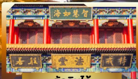
วัดจีนไท่