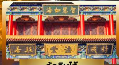
วัดจีนไท่