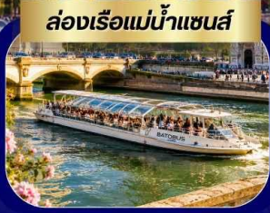
ล่องเรือแม่น้ำแซนส์