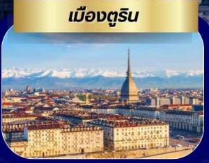
เมืองตูริน

เที่ยว 3 ประเทศ ฝรั่งเศส สวิตเซอร์แลนด์ อิตาลี เส้นทางยุโรปยอดนิยม ปารีส หอไอเฟล ประตูชัย พิพิธภัณฑ์ลูฟร์ ล่องเรือบาโตมูช ชมวิวปารีสบนสายน้ำ เจนีวา นาฬิกาดอกไม้ น้ำพุเจดโด้ เมืองโลซานน์ ศาลาไทยแห่งเมืองโลซานน์ เมืองเซอร์แมท หมู่บ้านโรัดยนต์ ชมวิวยอดเขาแมทเธอร์ฮอร์น เมืองซียง เมืองตูริน มหาวิหารตูริน เมืองมิลาน ดูโอโมแห่งเมืองมิลาน ช้อปปิ้ง SERRAVALLE OUTLET