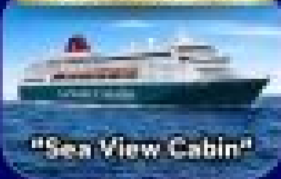
"Sea View Cabin"