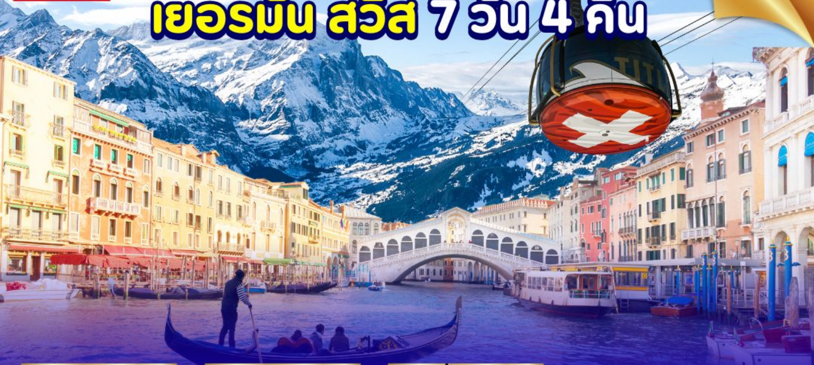
ยอดเขากิตลิส