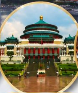
มหาศาลาประชาชน Great Hall of the People