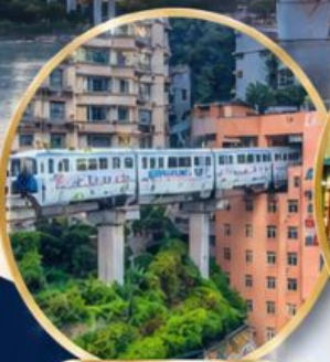
รถไฟทะลุติ๊ก Liziba Station