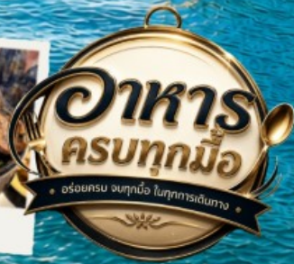
ปิ้งย่าง