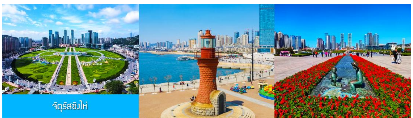
จัตุรัสซิงไห่

เช้า รับประทานอาหารเช้า ณ ห้องอาหารของโรงแรม (1)