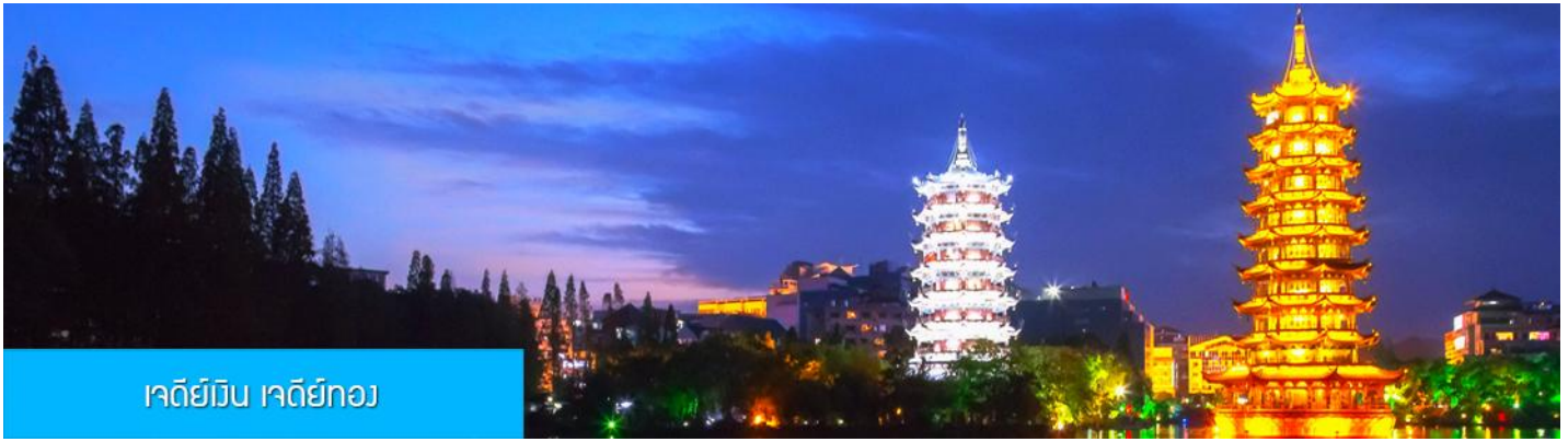
เจดีย์มื่น เจดีย์ทอง