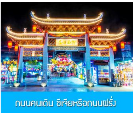
ถนนคนเดิน ซีเจียหรือถนนฝรั่ง