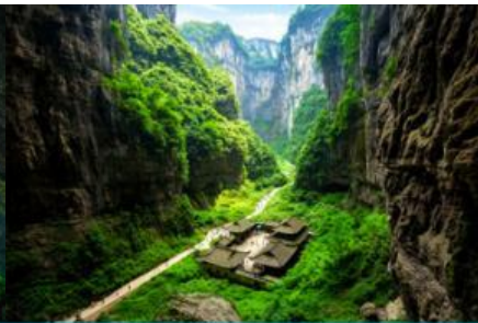
สะพานธรรมชาติสามแห่ง