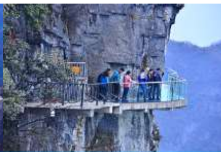
หน้าผาลอยฟ้าทงเดินกระจก