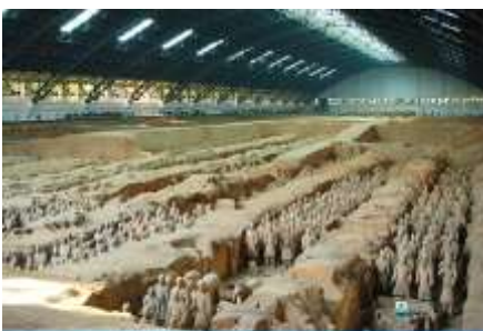
สุสานกอภัพทหารม้าจีนซี

พักที่ XINYUAN HOTEL 4* หรือ โรงแรมในระดับเดียวกัน เมืองหั่วซ่าน