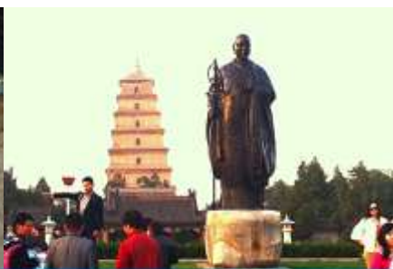
เจดีย์ห่านป่าใหญ่