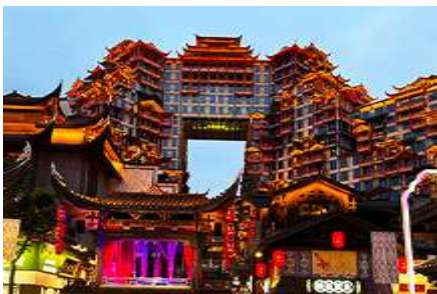
ตึกมหิศวรรษย์ 72 ชั้น

กรุณาเตรียม เสื้อผ้าและของใช้ 1 ชุด เพื่อ นอนพักในเมืองเก่าฟูหรงเจิ้นในคืนที่ 3 ของการเดินทาง ขอเป็นกระเป๋าคาด กระเป๋าถือลากใบเล็กไม่สามารถขึ้นรถคอลลีฟเข้าในหมู่บ้านได้ เป็นข้อห้ามของรถ จำเป็นต้องเรียนให้ท่านทราบต้องเป็นกระเป๋าคาดหรือเป้เท่านั้น