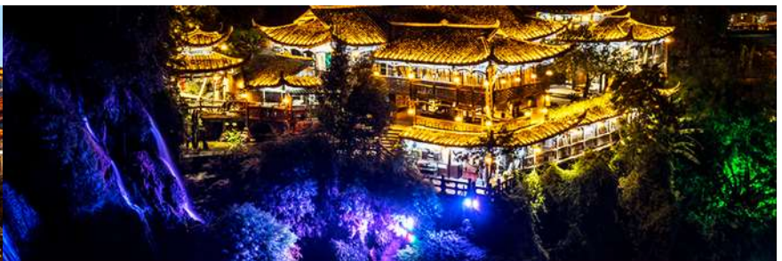
เมืองโบราณฟูหรงเจิ้น