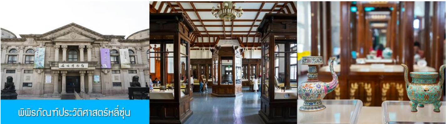
พิพิธภัณฑ์ประวัติศาสตร์หลี่ซุ่น

นำท่านเที่ยวชมและเก็บภาพ ณ สถานีรถไฟหลี่ซุ่น 旅顺火车站 เป็นสถานีปลายทางของเส้นทางรถไฟสาขา เส้นหยาง - ต้าเหลียน สร้างขึ้นในปีค.ศ. 1903 ออกแบบโดยสถาปนิกชาวรัสเซีย เป็นอาคารอิฐก่อปูนผสม โครงสร้างไม้ตามสถาปัตยกรรมรัสเซีย.