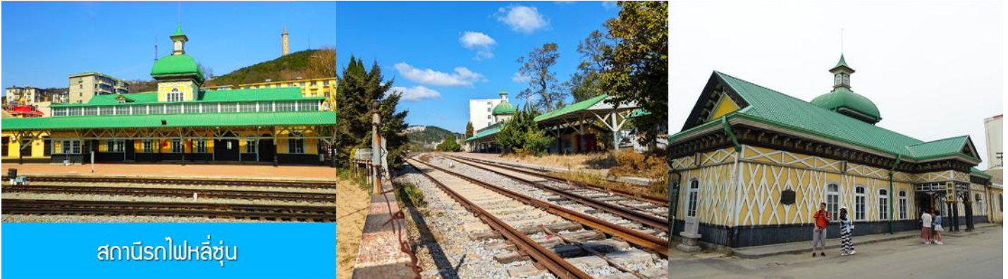
สถานีรถไฟหลี่ซุ่น

05.00 น. เรือท่องเที่ยวนำคณะเดินทางถึงท่าเรือเมืองต้าเหลียน นำท่านขึ้นรถบัสเพื่อเดินทางสู่ตัวเมืองต้าเหลียน เช้า รับประทานอาหารเช้า ณ ห้องอาหาร (7)