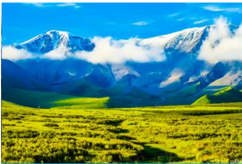
ทุ่งหญ้าเขาฉีเหลียน

จากนั้นนำท่านเดินทางโดยรถบัสสู่ทุ่งหญ้าฉีเหลียน (ระยะทาง 140 กม. ใช้เวลาเดินทางประมาณ 2 ชั่วโมง)