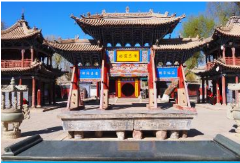
วัดพระใหญ่เมืองจางเยี่ย