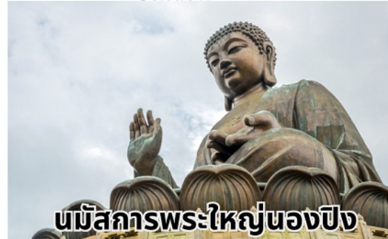
นมัสการพระใหญ่นองปิง