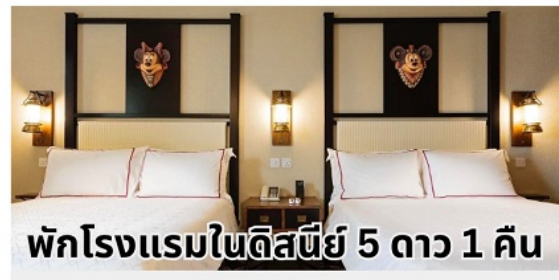
พักโรงแรมในดิสนีย์ 5 ดาว 1 คืน