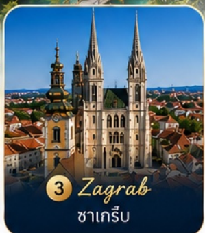
3 Zagreb ซาเกร็บ