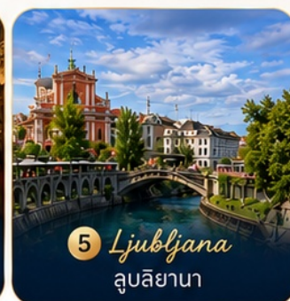
5 Ljubljana ลูบลียานา