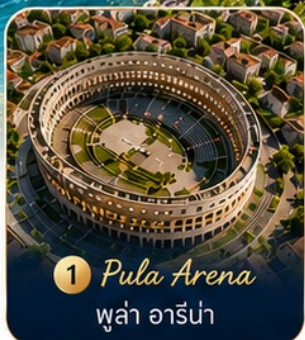
1 Pula Arena พูล่า อารีน่า