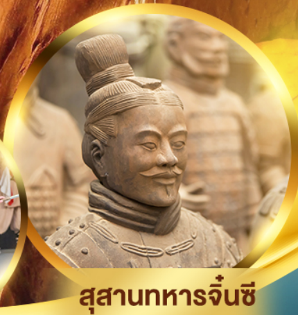
สุสานทหารจิ๋นซี