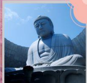
"HILL OF BUDDHA"