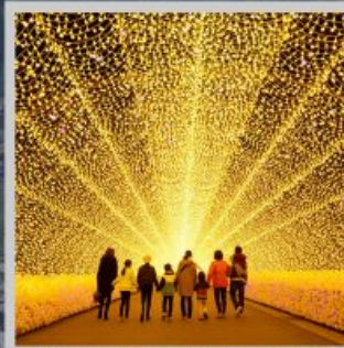
“NABANA NO SATO”