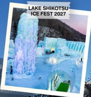
LAKE SHIKOTSU ICE FEST 2027