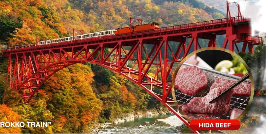
“KUROBE TOROKKO TRAIN”