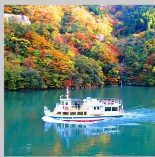
“SHOGAWA YURAN CRUISE”