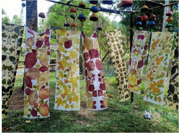
จากนั้น แวะชมศูนย์หัตถกรรมกลุ่มกะลามะพร้าว ผลิตภัณฑ์จากกะลามะพร้าว