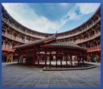
อุทยานมรดกโลก ภูเขาสีดรุณี อุทยานแห่งชาติระดับ 5A