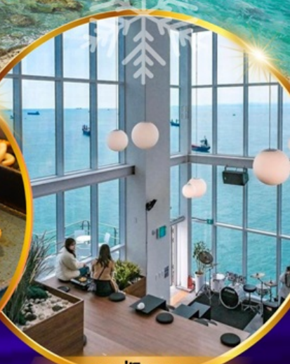
คาเฟ่วิวทะเล

ถ่ายรูปชิคๆ หมู่บ้านวัฒนธรรมคัมซอน เชคอิน คาเฟ่ริมทะเล วิวหลักล้าน ขึ้นเคเบิลคาร์ ชมทะเลปูซาน นั่งรถไฟปูคบุก sky capsule ห้ามพลาด!! ตลาดปลาที่ใหญ่ที่สุด ชิมของอร่อยที่ตลาดแฮอนแด อิสระช้อปปิ้ง Lotte Duty Free