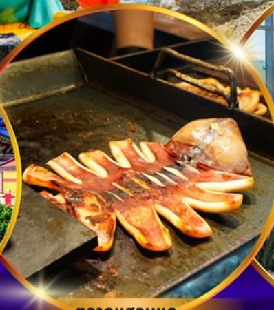
ตลาดแฮอนแด