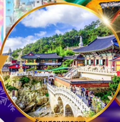
วัดแฮดงยงกุงซา