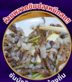
ห้ามพลาดอินปลาหมึกสด!!

ถ่ายรูปชิคๆ หมู่บ้านวัฒนธรรมคัมซอน เชคอิน คาเฟ่ริมทะเล วิวหลักล้าน ขึ้นเคเบิลคาร์ ชมทะเลปูซาน นั่งรถไฟปูคบุก sky capsule ห้ามพลาด!! ตลาดปลาที่ใหญ่ที่สุด ชิมของอร่อยที่ตลาดแฮอนแด อิสระช้อปปิ้ง Lotte Duty Free