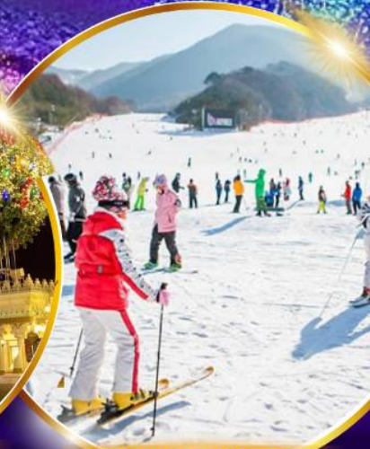
สนุกสุดมันส์ สกีรีสอร์ท

ชมจอ LED ขนาดยักษ์ที่รีสอร์ท 5 ดาว ใหญ่ที่สุดในเอเชียเหนือ สัมผัสหิมะสกีรีสอร์ท สนุกสุดมันส์ สวนสนุกเอเวอร์แลนด์ ชมพระราชวังคยองบกกุง ย้อนอดีตหมู่บ้านบุกซอน อันอก อิสระช้อปปิ้งคังนัม Lotte Duty Free