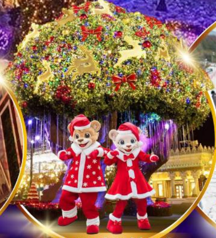
สวนสนุกเอเวอร์แลนด์ ซิม พาร์ค