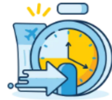
Check-in Time Limit