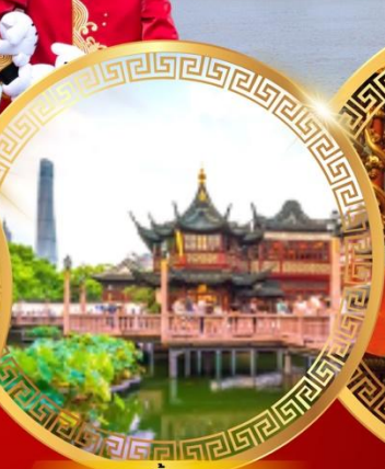
สวนอี๋หยวน