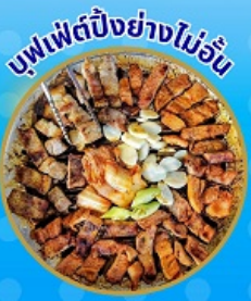
บุฟเฟ่ต์ปิ้งย่างไม่อื่น