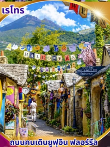
ถนนคนเดินยูฟูอิน ฟลอร์ริล