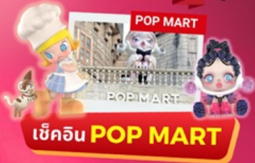
เช็किन POP MART