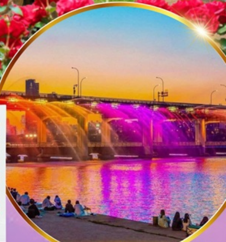
ชมสะพานน้ำพุสายรุ้ง