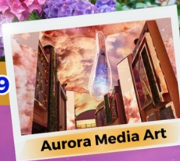
Aurora Media Art