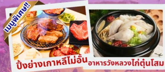
ปิ้งย่างเกาหลีไม่อื่น อาหารวังหลวงไก่ตุ๋นโสม