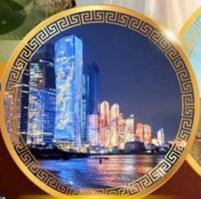
No.3 Bathing Beach

ลานจัดงานเบียร์ชิงเต่า Golden Beach ทางเดินไม้ริมทะเล ศาลเจ้าเทพทะเล ถนนคนเดินโตตง พิพิธภัณฑ์เทศบาลชิงเต่า สวนสาธารณะซิกแนลฮิลล์ ถนนหลงเจียงสู่ กระเช้าเขาไท่ผิง ยาน Da Bao Island โบสถ์ st.Michael's Cathedral ถนนจงชาน ถนนคนเดินฟิลาญย่วน จัตุรัสเบย์ไพร่