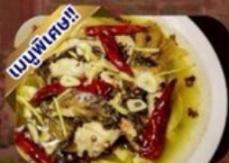
ปลาต้มพริกทอด