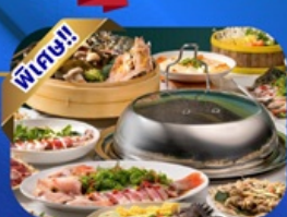
บุฟเฟ่ต์เช้า