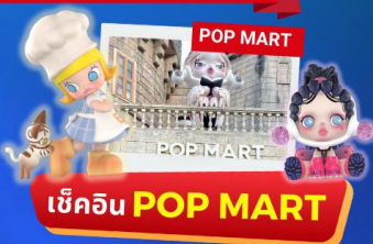
เช็คอิน POP MART