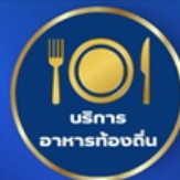
บริการ อาหารท้องถิ่น