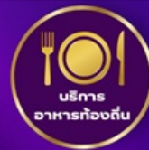
บริการอาหารท้องถิ่น