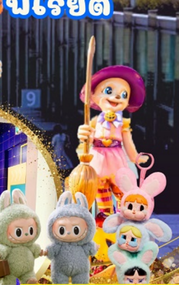
ชาว Art toy ห้าพลาต ตามล่าหา Labubu กับ PPG ที่โซ