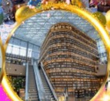
ห้องสมุด Coex mall