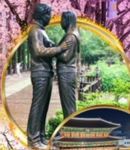
ป้อมฮวาซอง