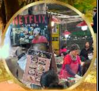
สตรีทฟู้ดตลาดกวางจ้ง