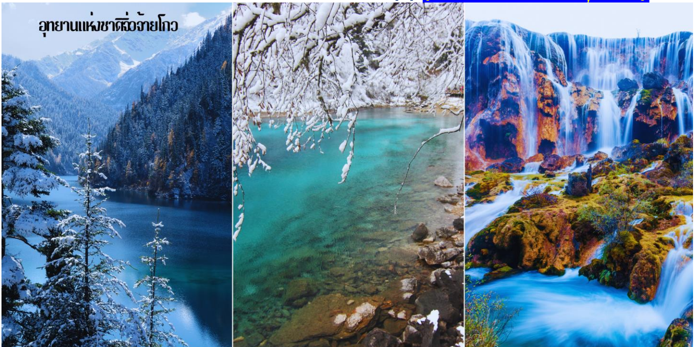
อุทยานแห่งชาติจิวจ้ายโกว

กลางวัน ๑๐บริการอาหารกลางวัน ณ ภัตตาคาร(6) (ห้องอาหารภายในอุทยาน)