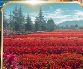
สวนดอกไม้ HUA YU MU CHANG