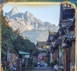
เมืองโบราณซูเหอ