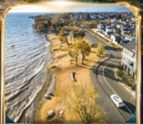
ทะเลสาบเอ่อไห่ โค้งตัว S