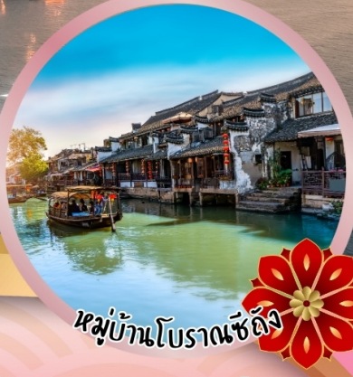
หมู่บ้านโบราณซีตง