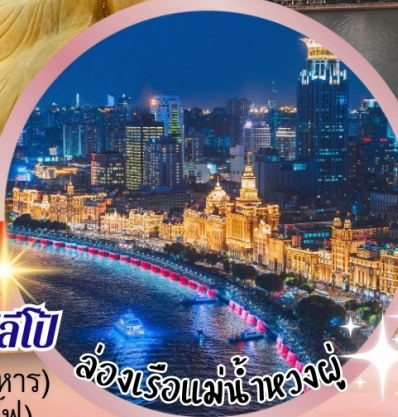
ล่องเรือแม่น้ำหวงผู่