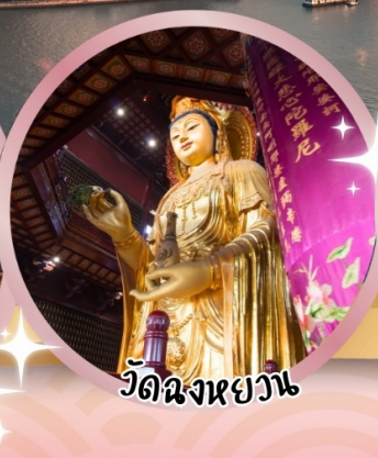
วัดฉงหยวน