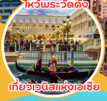
เที่ยวเวนิสแห่งเอเชีย