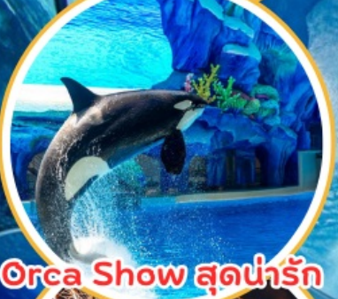
Orca Show สุดน่ารัก