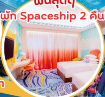
ฟินสุดๆ พัก Spaceship 2 คืน!!