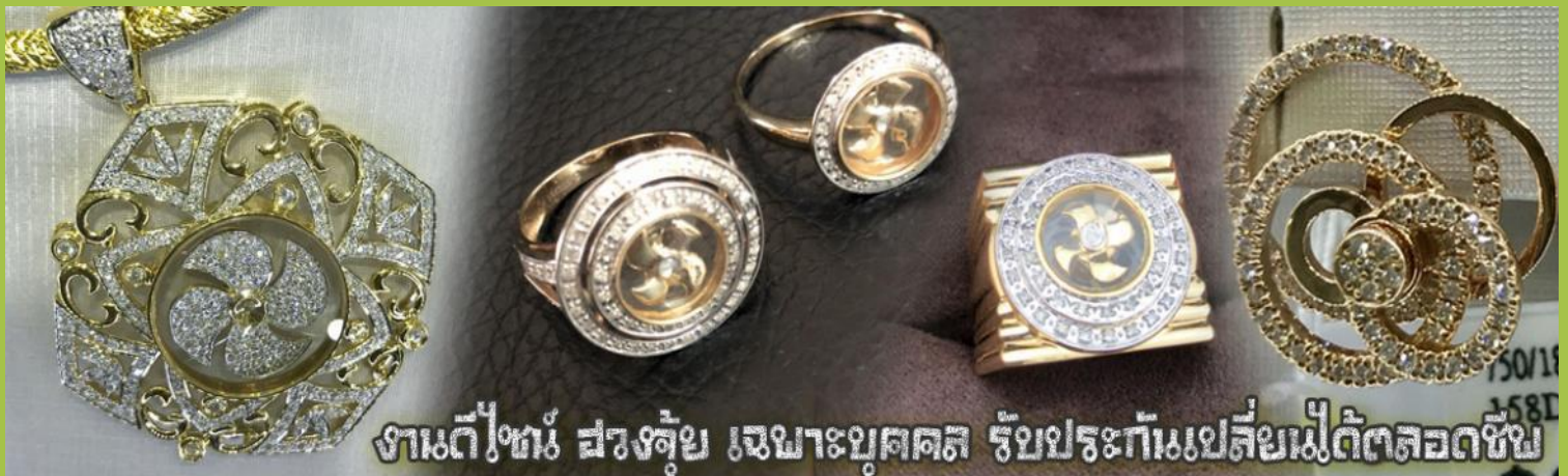
งานดีไซน์ ฝรั่งคู่ขี้ เมฆาษบุคคล รับประกันเปลี่ยนไม่ตัดยอดชีพ

นำท่านเยี่ยมชม โรงงานจิวเวลรี่ ที่ชั้นชื่อของฮ่องกงพบกับงานดีไซน์ที่ได้รับรางวัลอันดับยอดเยี่ยม และใช้ในการเสริมดวงเรื่อง ฮวงจุ้ยนำความโชดดี มั่งมั่งแก่ผู้สวมใส่ ซึ่งในเมืองไทยก็ได้นิยมแพร่หลายออกไป ไม่กว่าจะเป็นกลุ่ม ดารา นักการเมือง พ่อค้าแม่ขายที่ประกอบธุรกิจ เจ้าของกิจการห้างร้านต่าง ๆ ซึ่งเชื่อกันว่าจะนำสิ่งดี ๆ ปัดเป่าสิ่งชั่วร้ายให้กับบุคคลที่สวมใส่ ซึ่งจะมีมากมายหลายชนิด เช่นจี้กิ้งกัน แหวนรุ่งต่าง ๆ นาฬิกาข้อมือ (ซึ่งผู้สวมใส่จะได้รับการดูลายมือจากซินแซประจำร้าน เพื่อนำวิธีการเสริมดวงในการสวมใส่โดยไม่ได้ค่าบริการ)