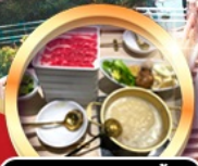
บุฟเฟ่ต์ชาบู เมื่อบริไม้อัน!!