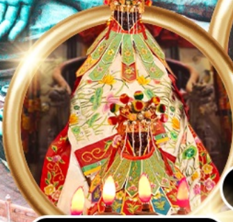
ยืมเงินเจ้าแม่กวนอิมสองห้า