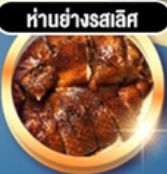
ทำอย่างรสเลิศ