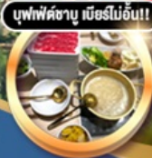
บุฟเฟ่ต์ชาบู เมื่อก่อน!!