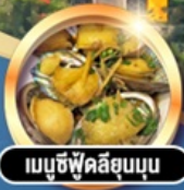
เมนูซีฟู้ดลิ้นจี่อบ