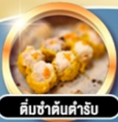
ติ่มซำคั่นคำรับ

ต.ค. 18-20, 25-27 พ.ย. 15-17, 22-24, 29-1 ธ.ค. 13-15, 20-22