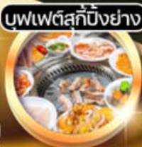
บุฟเฟ่ต์สุกี้ปิ้งย่าง