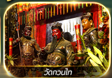
วัดกวนไท

ไหว้ 8 เซียนวัดดัง ปิงไม่หยุด ครบถ้วน!! การเงิน การงาน ความรัก และสุขภาพ นั่งรถราง PEAK TRAM, ชมวิวยอดเขาคอดอเรีย, เจ้าแม่กวนอิมหาดริฟลิสเบย์, วัดหลินฟ้า, วัดเจ้าแม่กัมมทิน วัดหวังต้าเซียน, วัดกวนไท, วัดสองอ้า, วัดแชกงหมิว, กระเช้านองปิง 360, พระใหญ่เทียนถาน