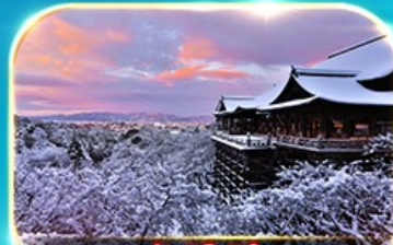
วัดคิโยมิตสึ