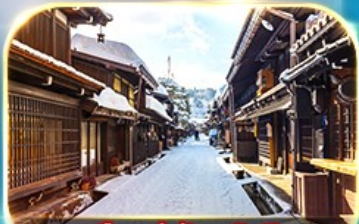
เมืองเก่าซันมาชิซูจิ