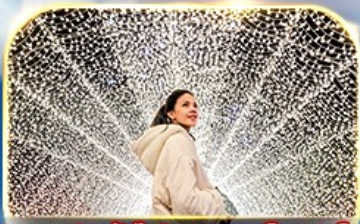
ชมงานประดับไฟนาบามา โนะ ซาโตะ