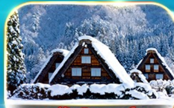
หมู่บ้านชิราคาวาโกะ

ชมความงามของปราสาทโอซาก้า ถ่ายรูปเช็คอินป้ายกูลิโกะที่ชินไซบาชิ หมู่บ้านชิราคาวาโกะ วัดคิโยมิตสึ วัดโทไดจิ ซันมาชิ ซูจิ